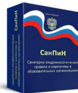
Санитарно-эпидемиологические правила и нормативы СанПиН 2.4.2.2821-10 утратили свою силу с 1 января 2021 года

Обращаем внимание на то, что при любой температуре образовательная организация обязана организовать учебный процесс для любого количества обучающихся, в частности правовых оснований отмены учебных занятий из-за сильных морозов в настоящее время не имеется.