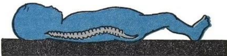
правильно (ровный твердый матрас и отсутствие подушки)

Так как физкультурные занятия с детьми в детском саду проводятся 3 раза в неделю ( в средней, старшей группах), то этого недостаточно для профилактики нарушений осанки и плоскостопия. Необходимо родителям в повседневной жизни следить за правильным положением тела, создавать необходимые условия в семье (спать на жесткой кровати, подушка не должна быть высокой и т.п.)