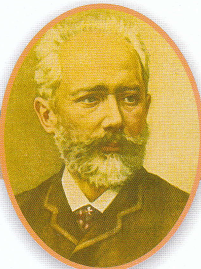
Петр Ильич Чайковский Великий русский композитор