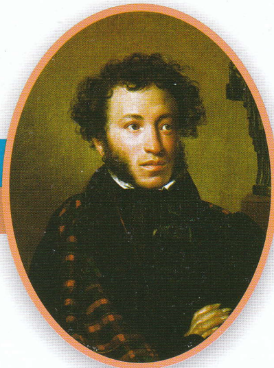
Александр Сергеевич Пушкин Великий русский поэт