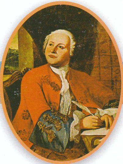
Михаил Васильевич Ломоносов Великий русский ученый

Ты, конечно же, вспомнишь, что Александр Сергеевич Пушкин написал много прекрасных стихов и чудесные сказки: «Сказка о царе Салтане», «Сказка о рыбаке и рыбке», «Сказка о мертвой царевне и о семи богатырях», «Сказка о золотом петушке». Петр Ильич Чайковский писал необыкновенно красивую музыку, создал цикл пьес «Времена года» и хорошо знакомый тебе «Детский альбом». Михаил Васильевич Ломоносов — великий русский ученый, он многого добился в самых разных областях знаний: литературе и искусстве, физике и астрономии, географии и истории. Им сделано много важных научных открытий. Юрий Алексеевич Гагарин был первым космонавтом, первым человеком, облетевшим на космическом корабле «Восток-1» нашу планету.