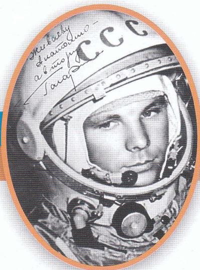
Юрий Алексеевич Гагарин Первый космонавт